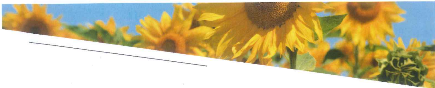
SUPERFICIE DE GIRASOL EN CASTILLA LA MANCHA Datos PAC (Has)