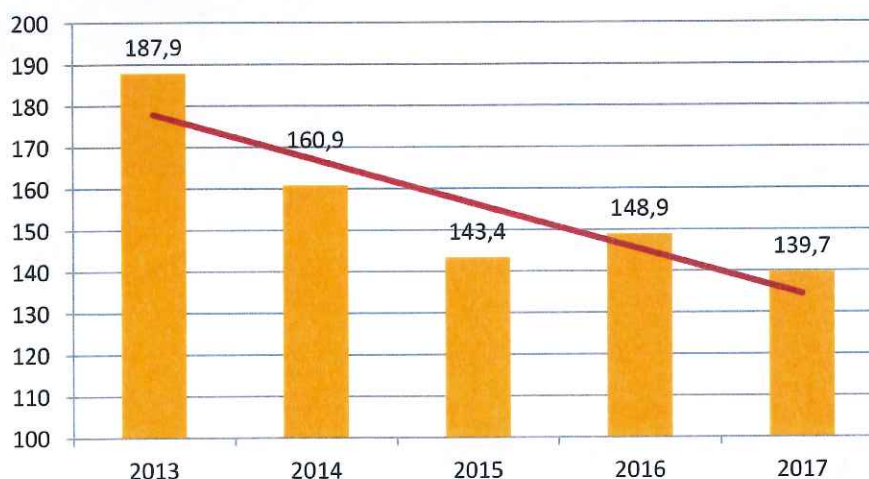
EVOLUCIÓN PRODUCCIÓN GIRASOL CASTILLA-LA MANCHA (Miles Tn)